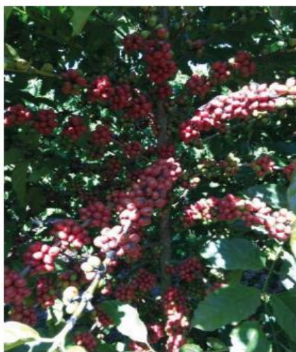
Figura 1. Produção de café em Vila Valério, ES (2021)